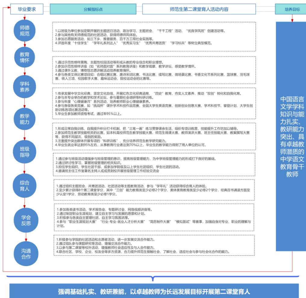
图 2 对标师范认证的汉语言文学师范的第二课堂育人架构

以提升汉语言文学师范生演说技能为例，演说技能是学科扎实素养、语言文字运用基础、逻辑思维能力和沟通表达素养高度综合体现的能力。在师范生日常形成了“‘名师+经典’典范—赛事浸润—朋辈探讨”第二课堂育人机制：一是在日常班级学习、活动中渗透“教育家精神”“全国教书育人楷模”等师德规范内容，将政治学习与“立德树人”“以德育人”有机结合，引导师范生做到“以言传师魂，以行践师德”，注重师德师风；二是每年面向全体师范生举办“师范生口语风采大赛”，并挖掘先进分子推荐参与到“南粤师魂杯”等省级教师演说大赛，兴趣分子参与到赛事旁听学习，贯彻“以赛促教”“以赛育德”的理念；三是定期组织“朋辈讲堂”，组织邀请在相关演说类赛事中表现优秀的师范生、校友返校开展交流会，推动师范生掌握演讲表达的提升技巧，聆听“师范生自我成长成才”的故事，促进师范生善于合作、加强良好的表达与沟通能力，以强化在“班级指导、育人、学会反思、沟通合作”等指标支撑作用。